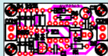
Rys. 2 Schemat montażowy

twem diody Zenera D1 i rezystora R2 na bazę tranzystora T1. Do detekcji stanu linii telefonicznej wykorzystujemy zjawisko obniżenia się na niej napięcia podczas prowadzenia rozmowy. Normalnie napięcie to wynosi ok. 60V natomiast po podniesieniu słuchawki spada do ok. 6... 10V, w zależności od typu aparatu. Tak więc jeżeli linia telefoniczna jest wolna, to tranzystor T1 przewodzi, zwierając do masy wejście zezwolenia generatora multistabilnego IC1. W tym stanie układ pobiera pomijalnie mały prąd, szczególnie w przypadku zastosowania układu NE555 w wersji CMOS.